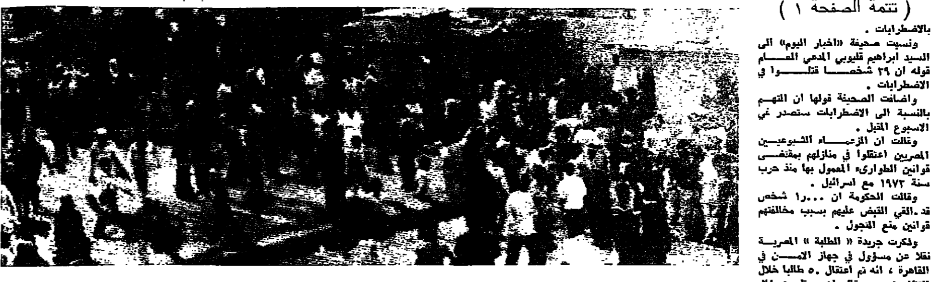
مظاهرون في القاهرة يوم الخميس الماضي

الملك حسين: دول المساندة تتحمل مسؤولية أحداث مصر قال الملك حسين في حديث نشرته « الامرام » امس : انني ادرك خطورة ما حدث من اعمال شغب في مصر ، وان مسؤولية ذلك تقع على عاتق دول المساندة التي يجب ان تودي دورها كاملا في هذه المرحلة الحسنة والخيرة التي نرى بها الامة العربية . وتابع يقول : يجب الا ننسب بالعمد في محاولته لاصناف الصف العربي . ومن ثم يسس دور دول المساندة التي يجب ان تزيد من دعمها لدول الجوارحة لتواجه مسؤوليتها على المستوى الوطني والمستوى القومي . وأضاف قائلا : في الحقيقة ، فان مصر قد تصلت وتصلت الكثير ، وواجب العرب الان التوقف لدى جوارها من اجل اجتناب خطر فترة تير بها بلاندا العربية الان وهذا واجب تاريخي ومسؤولية كبرى .